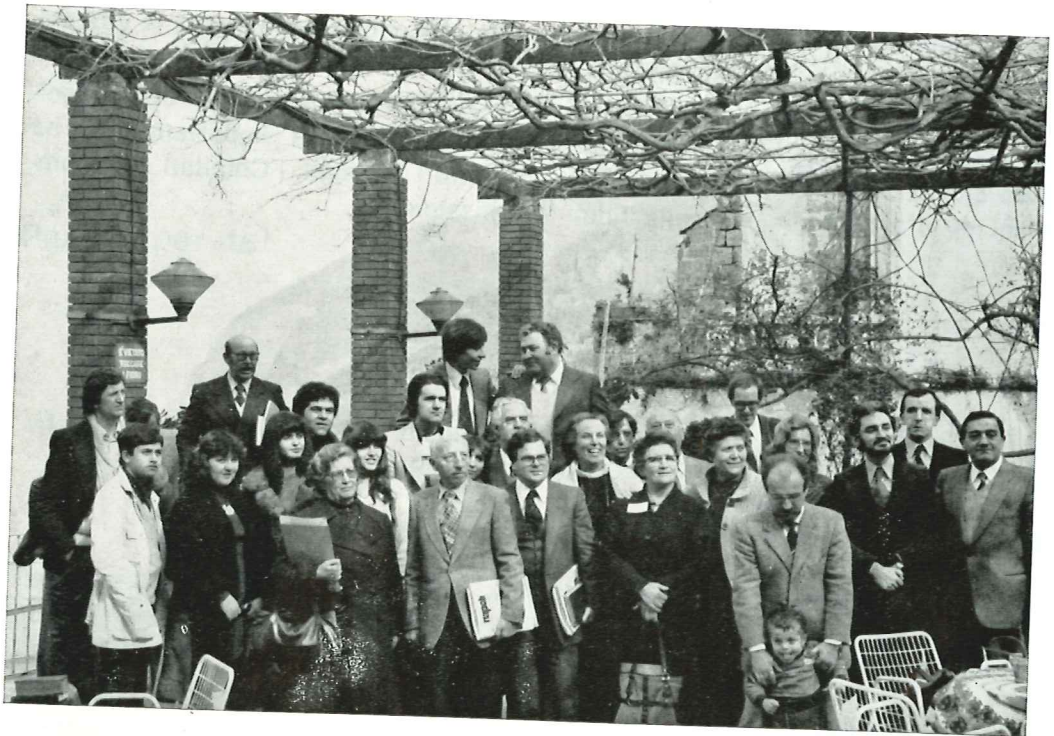
Alcuni dei partecipanti alla 14 ma Assemblea Distrettuale a Vico Equense.

La 14 ma Assemblea Distrettuale si è tenuta a Vico Equense (NA) da 15-17/2/1980. Circa ottanta persone sono convenute a Vico per la nostra assemblea annuale del distretto. Fra i delegati ci è stata molto gradita la rappresentanza della nostra Scuola Biblica di Büsingen guidata dal Dr. e Sig.ra Bennett Dudney.